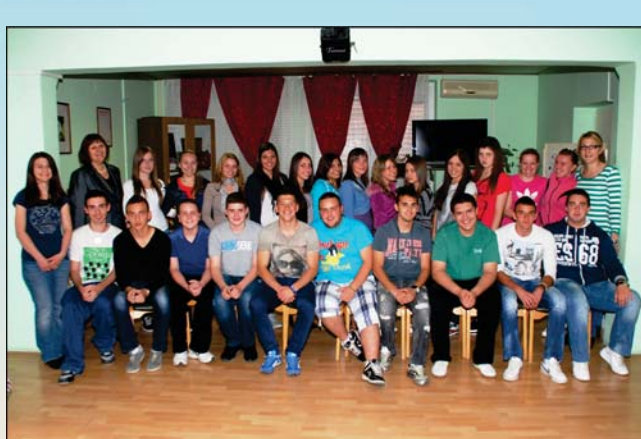
Једанаеста васпитна група