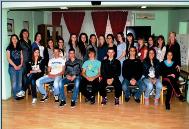
Четврта васпитна група