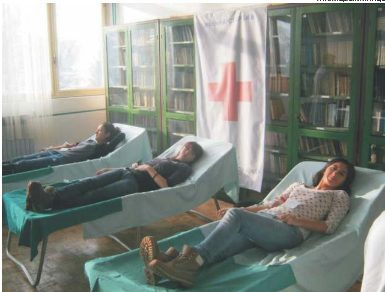
У акцији добровољног давања крви учествовали су и наши матуранти.