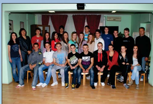
Девета васпитна група