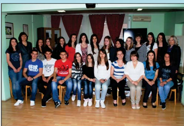
Шеста васпитна група