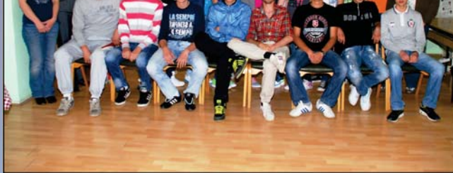
Друга васпитна група