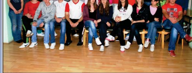
Седма васпитна група